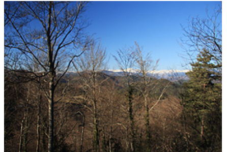
El Pirineu des de Sant Martí de Vinyoles

A l'any 1703 va ésser modificada considerablement ja que s'hi van construir dues capelles laterals, el campanar de base quadrada i també una sagristia. A prop de Sant Martí de Vinyoles, es troba Santa Margarida de Vinyoles, situada a prop del cim de 1.208 metres del mateix nom, i possiblement en l'antic castell de la Guàrdia.