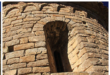
Finestra romàntica i modilló lombard