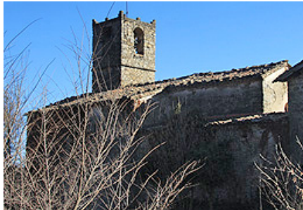
Campanar de l'església