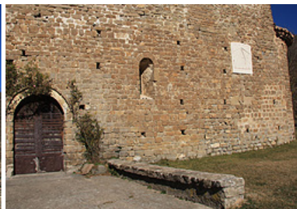
Entrada a l'església