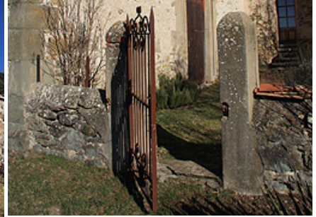
Entrada a l'església

El seu accés és a través d'una pista forestal formigonada en prou bon estat, que també porta a Sant Martí de Vinyoles, en el punt quilomètric 183,7 Km. de la C-26 de Berga a Ripoll per Les Llosses, on hi ha el Restaurant El Cremat, s'inicia la pista forestal fins arribar a Sant Sadurní de Sovelles que es troba a 7 quilòmetres i a pocs quilòmetres abans hi ha la de Sant Martí de Vinyoles, també en bon estat fins poc abans d'arribar a Sant Martí que està molt malmesa.