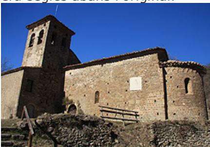
Església de Santa Maria de Les Llosses

Una de les altres parròquies és Santa Maria de Les Llosses, situada a pocs quilòmetres de la de Santa Maria de Matamala, concretament a 2 Km. en el lloc conegut com a Pla de Capdevila. Es un temple que fou propietat del monestir de Ripoll, i des d'aquella època, el segle XII s'hi ha fet modificacions però no tantes com a Matamala, fet que ha permès tenir una millor idea de com era segles abans l'original.