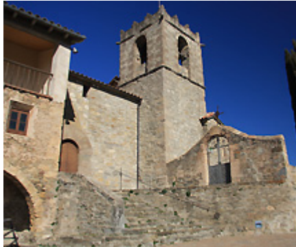
Església de Santa Maria de Matamala