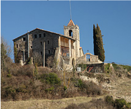
Santa Maria de Matamala

Aquest tipus d'edificis religiosos amb més de 1.000 anys d'història, han estat subjectes al llarg de la seva vida, de múltiples transformacions, enderroc, destruccions o ampliacions, i a vegades es fa difícil establir amb exactitud els seus orígens sobre tot arquitectònics, que és bases en hipòtesis arran de excavacions i altres estudis.