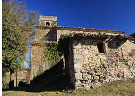
Sant Sadurní de Sovelles