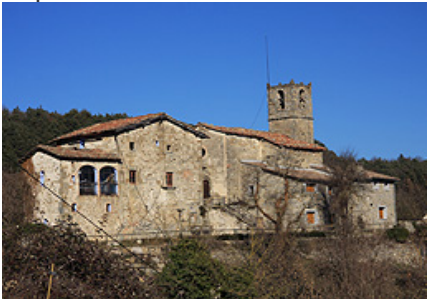
Sant Martí de Vinyoles