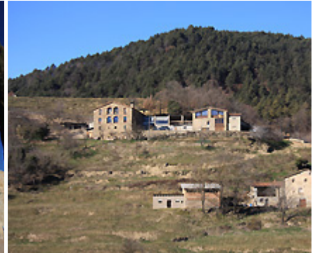
El Lladrer de Matamala